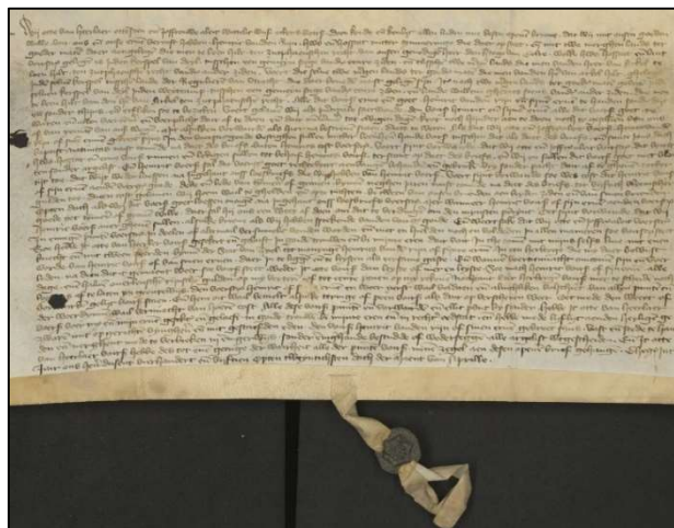
Oorkonde archief huizen Waardenburg en Neerijnen 1415

De oudste oorkonde van het huis en hofstede Bakerbosch is van 1415, die gevonden is in het archief van de huizen Waardenburg en Neerijnen.